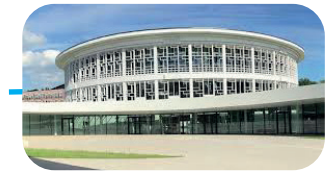
Lilliad - Learning center innovation