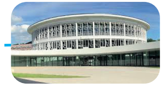
Lilliad - Learning center innovation