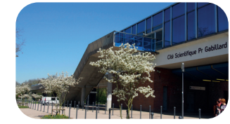
Métro cité scientifique Pr Gabillard