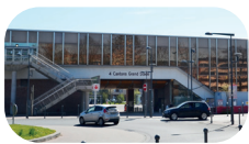
Métro 4 cantons Stade Pierre Mauroy